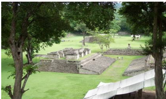
Vis ite du

Surnommé "L'Athènes Maya", Copán est un joyau de l'art Maya avec ses nombreuses places, temples, courts de jeu et stèles sculptées de l'époque classique. Situé dans la petite vallée des sous affluents du Rio Motagua, le Rio Copan, à une altitude de 620 m, le site s'étend sur une superficie de 13km sur 2,5km.